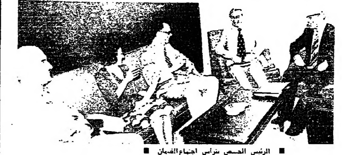
الرئيس الحصن سراس اجتمع الضمان

انتهى عند الساعة التاسعة من صباح يوم 20 حزيران الجاري عملية التتبع بسندات الخونة بقيمة 150 مليون ليرة حسب التصيم مودع بدء الانتخاب اي في الساعة الثانية من بعد الظهر .